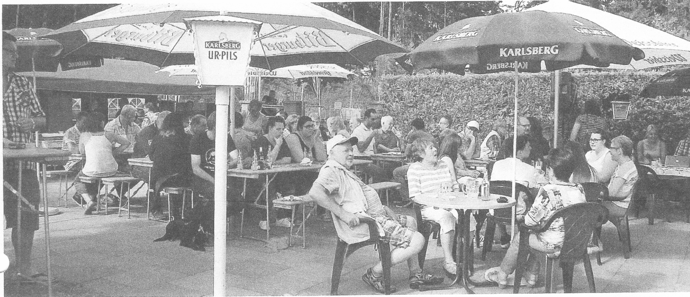
Mitte August lädt der Schützenverein zu seinem traditionellen Fest ans Schützenhaus ein.

Saarbrücker Zeitung 09.06.2019 Ausgabe Saarzois