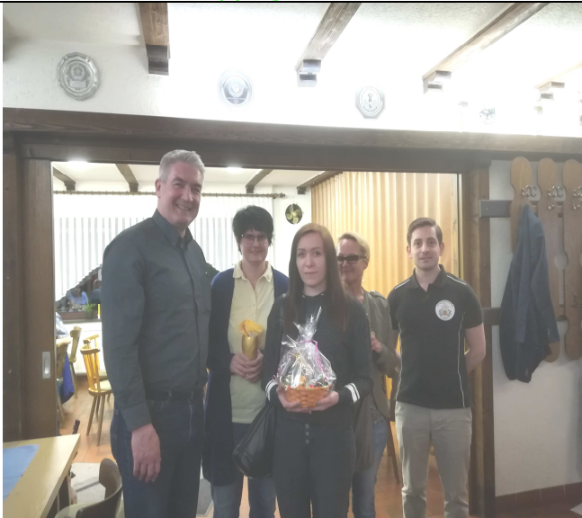
So sehen erfolgreiche Damen aus