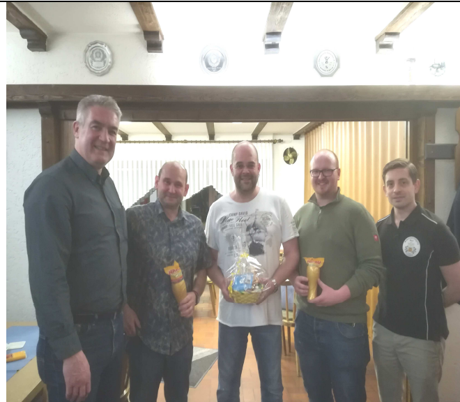
und so die Herren