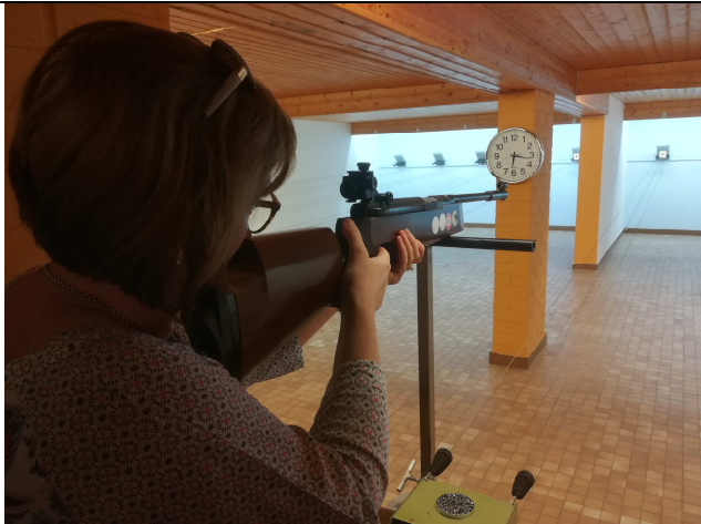
Das Schießen klappt gut